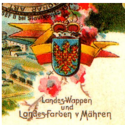
Zemské barvy a znak Moravy, 1900

Dnešní hojně rozšířená podoba moravské vlajky vychází ze zemských barev, zlaté a červené, kterých se od počátku 19. století používalo k výzdobě, později začaly být vyvěšovány i jako prapory. Oficiálního stvrzení se dočkaly v roce 1848, kdy poslanci Moravského zemského sněmu schválili 5. článek nové moravské ústavy, ve kterém se definuje zemský znak a zemské barvy: „ Země moravská podrží dosavadní svůj erb zemský, totiž orlici vpravo hledící, v poli modrém a červenozlatě kostkovanou. Zemské barvy jsou zlatá a červená. “ Od stanovených zemských barev byla následně odvozena moravská vlajka, kterou tvoří dva vodorovné pruhy. Horní pruh je žlutý, spodní je červený. V druhé polovině 19. století a počátkem 20. století, v době