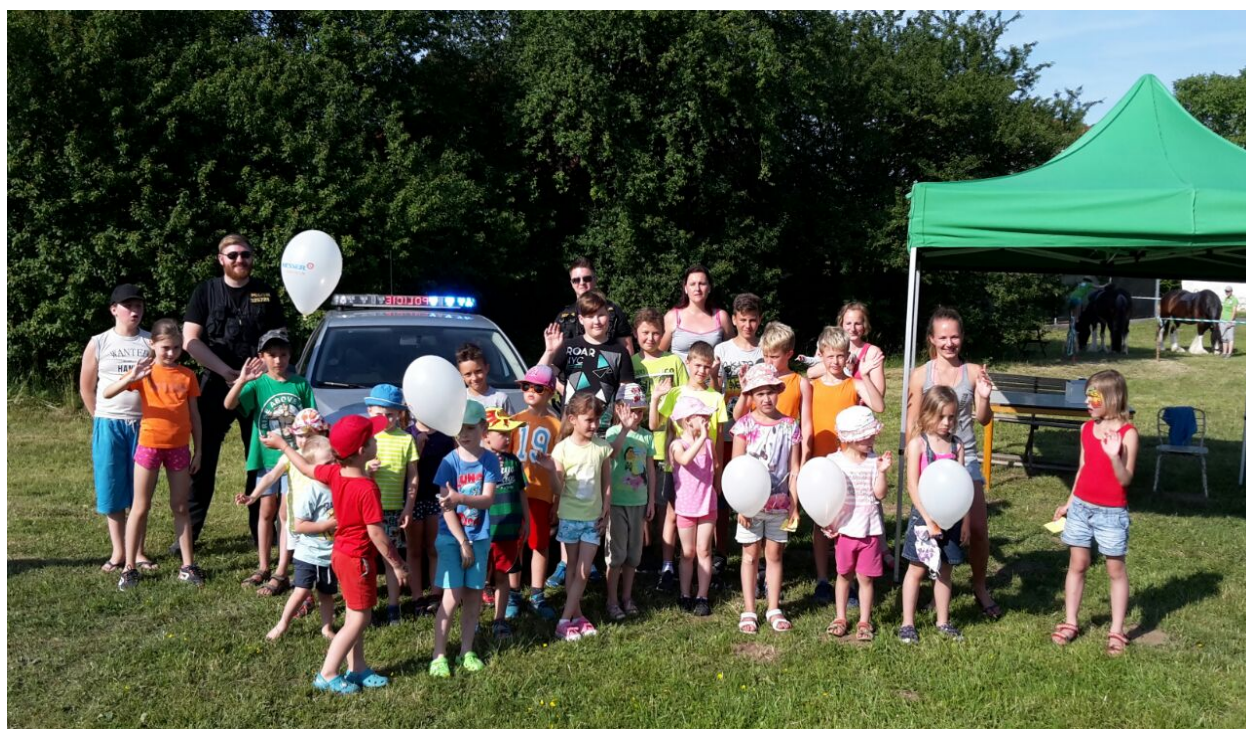
Dětský den v Topolanech